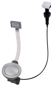
Automatischer Abfluss Space - PA 8407 108