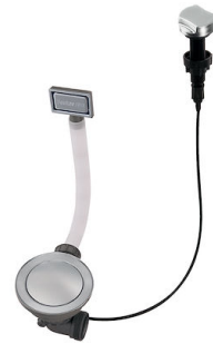
Automatischer Abfluss Space - PE 8407 109