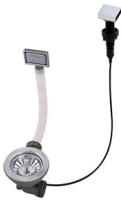
Automatischer Abfluss - PM 8407 113